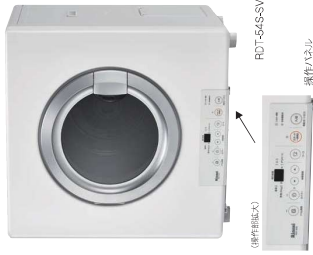
操作パネルは、洗濯機本体の上部・下部扉に設置