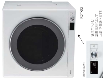
操作パネルは、洗濯機本体の上部・下部扉に設置