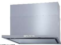
WATANABE WNBKS758YDXMSIL ◎173,030円(税込)