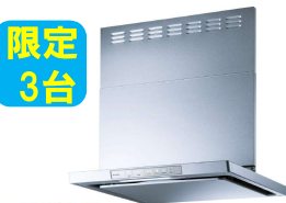
-FUJIOH- XGR-REC-AP604SV ◎216,040円(税込)