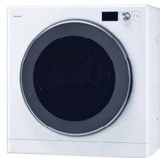
Rinnai RDT-93 乾燥容量9.0kg +基本部材セット ◎294,800円(税込)