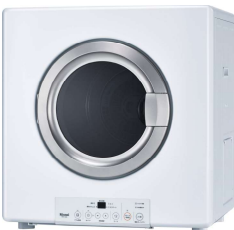
Rinnai RDT-54S-SV 乾燥容量5.0kg +基本部材セット ◎210,210円(税込)