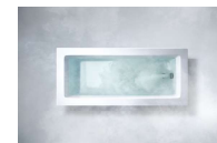
Rinnai ・RUF-ME2406AW (A) ・MBC-MB240VC (A) ・UF-MB1201AL-10A (A) ◎681,450円(税込)