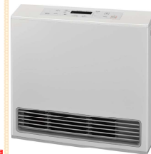
Rinnai RC-U5801PE-WH 木造11畳 コンクリート21畳 ◎113,190円(税込)