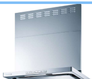
-FUJIOH- OGR-REC-AP752LSV ◎270,710円(税込)