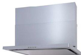
WATANABE WNBKS757CDMSIL ◎119,570円(税込)