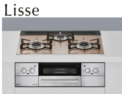
Rinnai 60cm幅 RHS31W32L22RASTW ◎264,440円(税込)