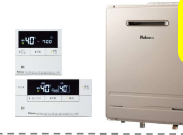
Paloma ・FH-E2022SAWL MFC-E226V ◎456,060円(税込)