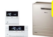
Paloma ・FH-E2012SARL MFC-E226V ◎470,250円(税込)