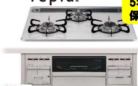
Paloma 60cm幅 PD-509WS-60CV ◎170,060円(税込)