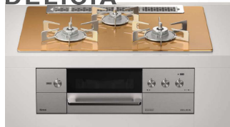
Rinnai 75cm幅 RHS71W31E12RCASTW ◎384,340円(税込)