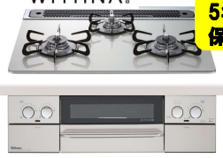
Paloma 60cm幅 PD-819WS-60GH ◎228,360円(税込)