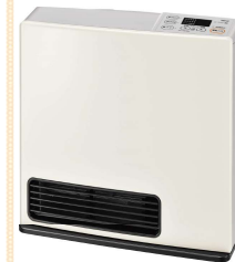
Rinnai SRC-365E 木造11畳 コンクリート15畳 オープン価格