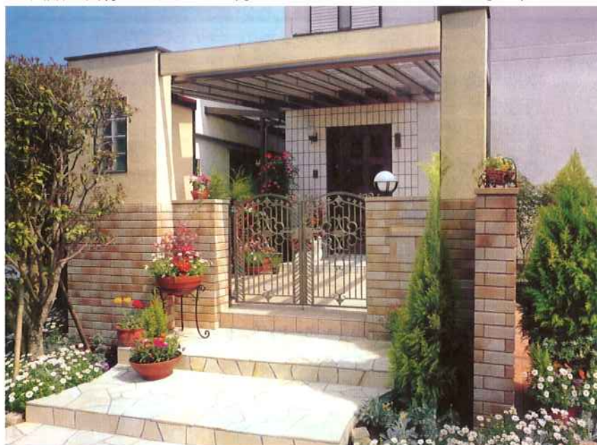
エントランスに屋根空間。素敵なコミュニケーションを。フライングパトレス風スタイルで、家の表情がもっと豪華に生まれ変わります。

水ぬるみ、木々の小枝で緑が出番を待っています。庭ではぼかぼか陽気に一足お先の春爛漫。家の中も花の似合う壁紙や出窓にリフォームできたら…。近頃地球環境に優しく、家計に優しい「エコ&エコ製品」がぞくぞく登場！当社ライフアのショールームにも画期的なリフォーム製品が皆様のお越しをお待ちしています。ぜひお立ち寄り下さい。