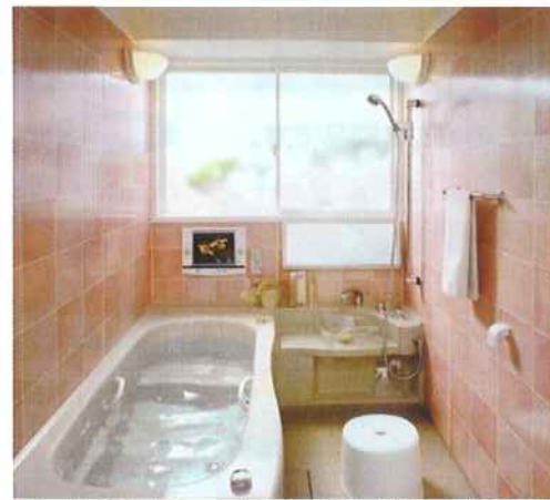
ノーリツ リフォームシステムバス グラシオ 暖房乾燥機等いろいろ揃ってます