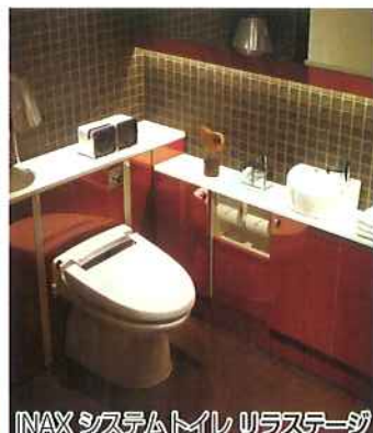
INAX システムトイレ リラステージ