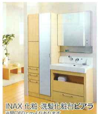
INAX 化粧・洗髪化粧台ピアラ ※間口60cmよりあります