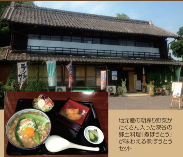
地元産の朝採り野菜がたくさん入った深谷の郷土料理「煮ぼうとう」が味わえる煮ぼうとうセット

【車でアクセス】 国道17号バイパスを深谷から本庄方面に向かい、矢島の信号を右折。2つめの信号を左折した先の右側にある渋沢栄一氏の生家の隣。